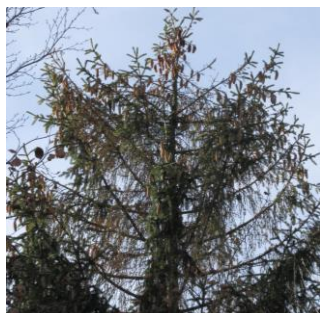
Vom Kupferstecher befallene Fichte im Gemeindeforest von Wegscheid.

Der trockene und sehr heiße Spätsommer 2015 mit Temperaturen von fast 40 Grad hat in weiten Teilen Bayerns zu starkem Borkenkäferbefall in den Fichtenbeständen geführt. Vor allem der wegen seiner geringen Größe von nur ca. 2 mm unscheinbare Kupferstecher hat noch im Herbst viele Fichtengipfel zum Absterben gebracht.