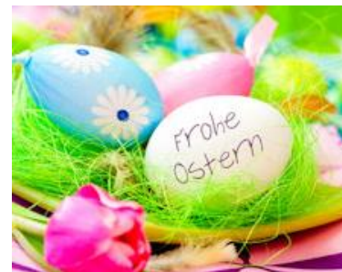
Josef Lamperstorfer 1. Bürgermeister